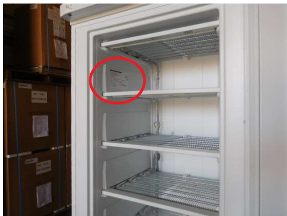
シリアル(製造番号)表記シール貼付部分