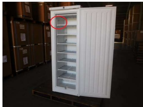
バスケットを全て外した状態