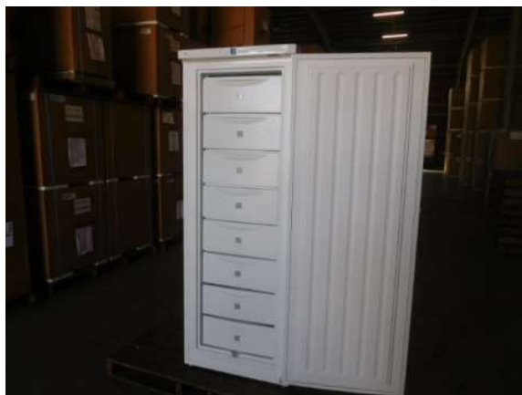
扉を開放した状態

※旧タイプは、中段付近に貼られていることが多いので、バスケットを抜いてご確認ください。